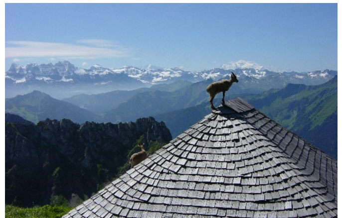
Sans doute une des photos les plus étonnantes de nos concours passé

Avez-vous réglé le montant de votre adhésion 2010 ? Si ce n'est pas le cas, vous pouvez encore le faire