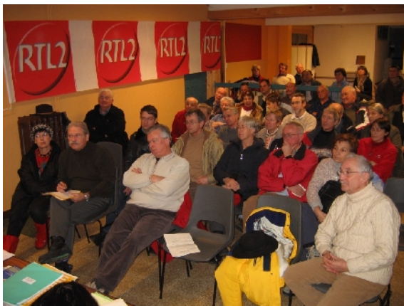
L'AG, un moment privilégié pour se rencontrer et rencontrer M le Maire et les responsables du tourisme