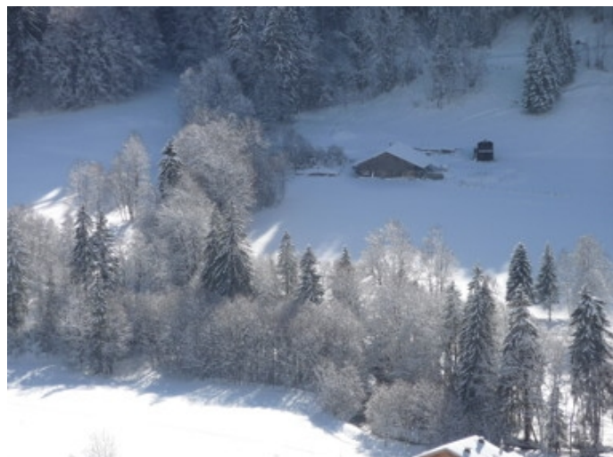
La neige est bien là, elle nous attend