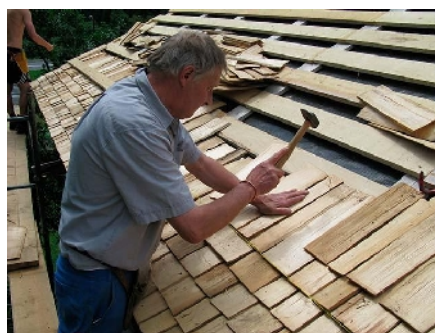
Le poseur de tavaillons : 1 er prix 2009