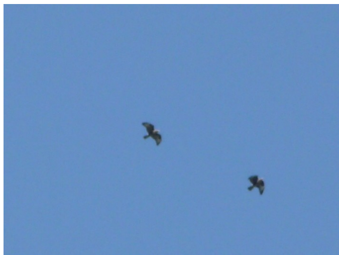
Un couple d'aigles au-dessus de la Chapelle

- Ayez un équipement adapté à la marche en montagne et à l'altitude