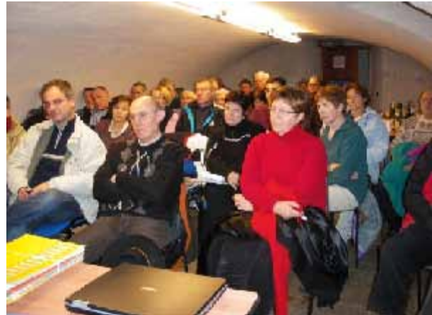
La salle voûtée était pleine pour cette AG 2008