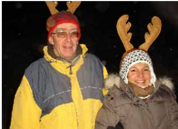
Un couple de caribous plus vrais que nature sur le Dahu

La chasse aux Caribous qui s'est tenue le 28/12 au pied du Crêt-Béni a plutôt bien fonctionné, malgré son annonce tardive. Une trentaine de chasseurs et chassés se sont poursuivis dans la bonne humeur en attendant les chocolat et vin chauds qui étaient les bienvenus pour combattre les - 14° affichés ce soir-là.