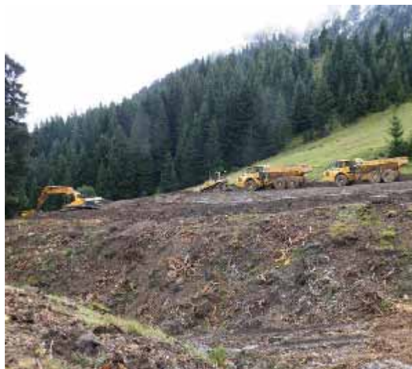
L'aménagement de la retenue collinaire du Crêt Béni

Comme chaque année, Monsieur le Maire a bien voulu nous recevoir en août pour d'horizon des projets en cours et à venir. Depuis, certaines annonces sont déjà réalité.