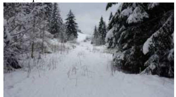
Un beau domaine de ski nordique

et qui nous tient informés des évolutions intéressantes comme les forfaits en prévente. Nous avons étrenné notre agrément en participant à deux consultations au titre de l'urbanisme, d'abord pour approuver la construction de la liaison entre Super-Châtel et le Linga qui devrait faire diminuer la circulation à Châtel (ceci au nom de la fédération départementale qui nous avait mandatés pour cela). Ensuite, nous avons aussi approuvé une modification du PLU de la Chapelle permettant de construire des logements derrière la Fruitière et la réalisation du Foyer Nordique.