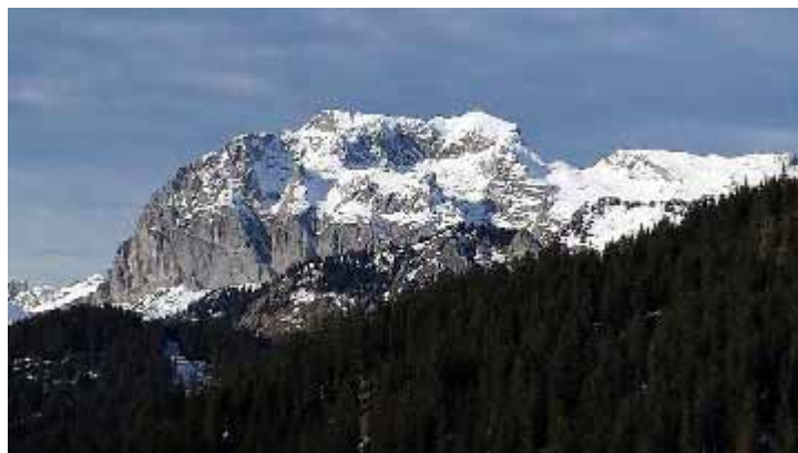
Un avant goût des vacances....

Jacques Cévest demande si des personnes de la salle sont candidates pour dynamiser le Conseil d'Administration. Aucune candidature nouvelle n'étant relevée, les 3 candidats sont élus à main levée, à l'unanimité.