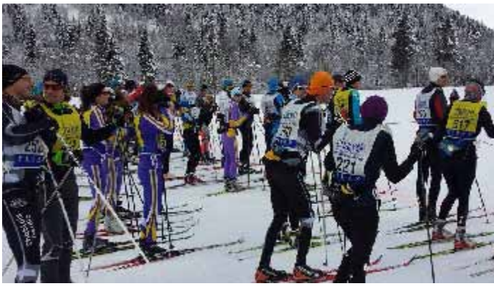
La Chapellane le 25 janvier