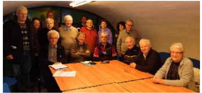
Fréquentation en légère baisse à l'AG de l'AARCA