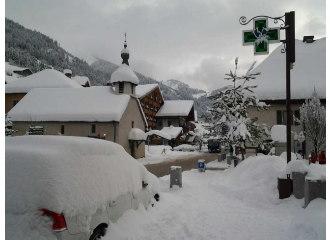
Il a neigé à la Chapelle...