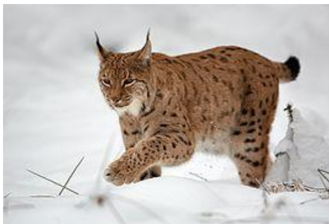
Le lynx en hiver

Un lynx a été repéré et photographié au Mont de Grange par une spécialiste locale de la faune sauvage. Rassurez-vous, l'animal ne chasse que pour manger et vous avez très peu de chances de le rencontrer tant il est discret.