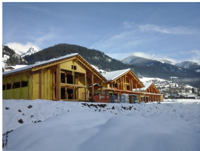
La future école de la Chapelle