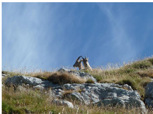
Rencontre au Linleu

Tous les deux résidents à la Chapelle et adhérents de l'Association de longue date.