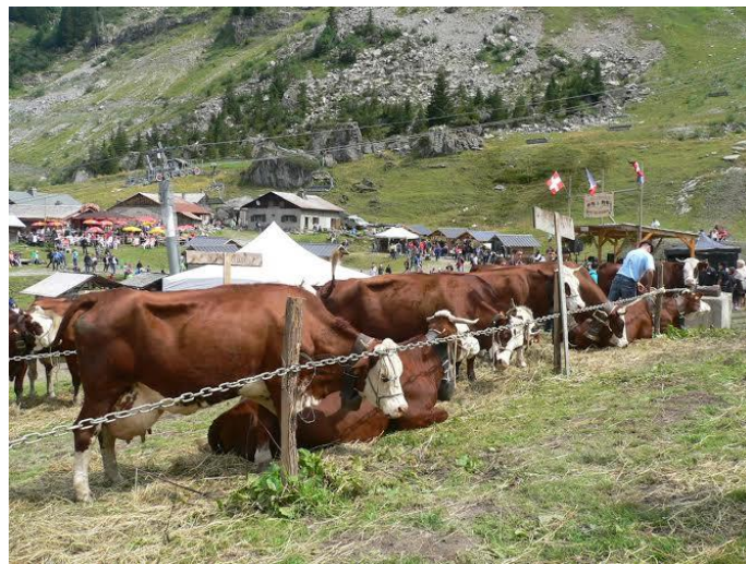
La Belle Dimanche en août, une fête typique et incontournable

La nouvelle communauté de communes verra ses compétences élargies, elle prendra notamment en charge l'assainissement et les déchets (ordures ménagères, tri sélectif et déchetteries) ainsi que la gestion des collèges.