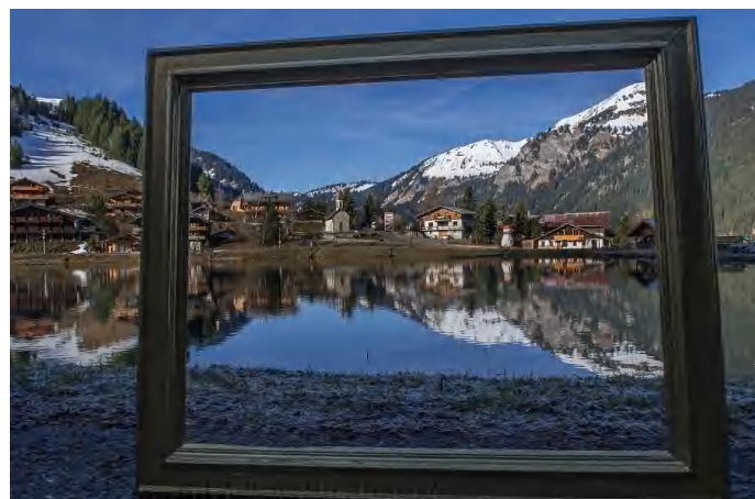
La Vallée d'Abondance quel cadre ! Par P Rouvillain (concours 2017)