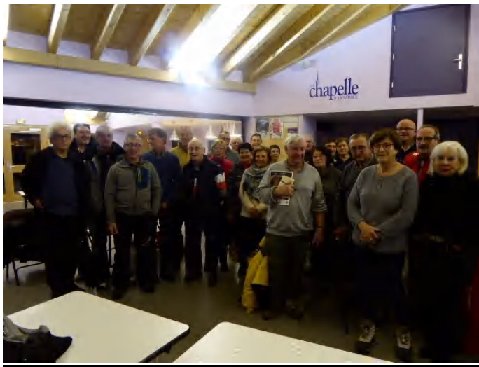
Assistance moyenne à l'AG dans le nouveau Foyer des 4 saisons