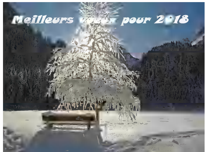
Une très belle archive des concours-photos (au lac de Vonnes)

Vote: Le rapport moral est adopté à l'unanimité