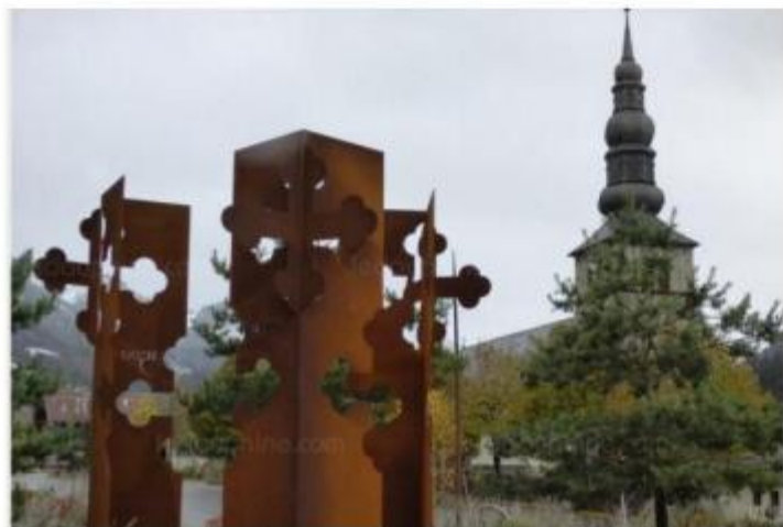
Les totems ont pris place au milieu du rond-point de l'église.

*d'une partie fixe (abonnement) qui varie en fonction du diamètre du compteur d'eau : 45€ pour 2018 pour un petit compteur d'appartement